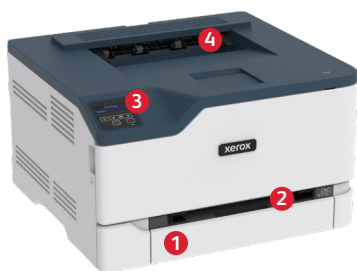
Impressora a cores Xerox® C230