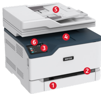
Impressora multifuncional a cores Xerox® C235